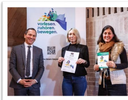
Preisträger Schülerbibliothek Max-Reger-Mittelschule Weiden

Beide Gütesiegel werden in einem Abstand von zwei Jahren verliehen.