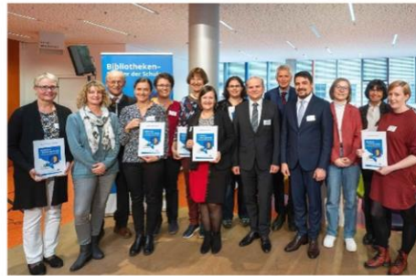
Preisträger/-innen „Bibliotheken – Partner der Schulen“ aus Niederbayern