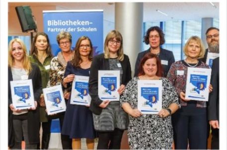
Preisträger/-innen „Bibliotheken – Partner der Schulen“ aus der Oberpfalz